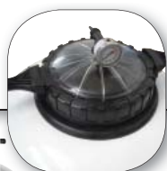
Version Side avec couvercle transparent